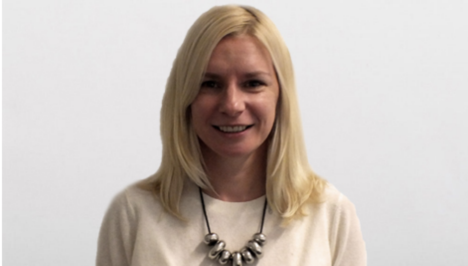
Liubov Markova | © GTAI