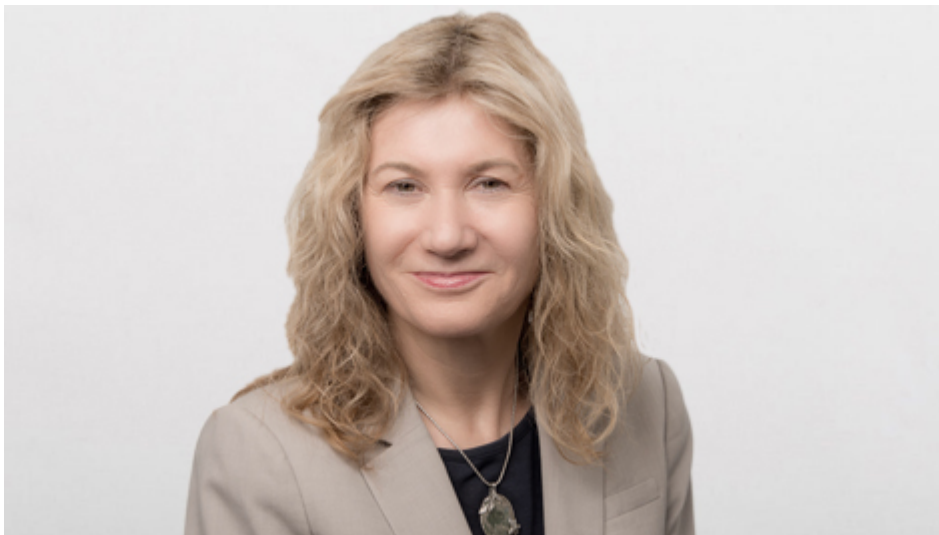
Ageiliak Geiger | © Studio Prokopy

101 Montgomery Street, Suite 2050 | San Francisco, CA 94104