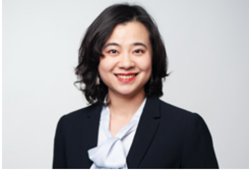
Jie Zheng | © GTAI