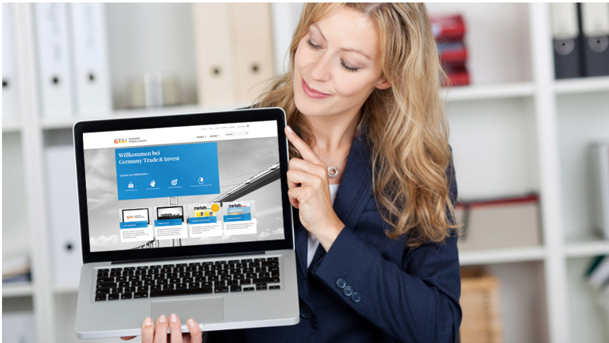
Frau zeigt auf Laptop mit GTAI-Website