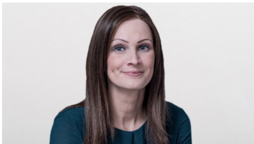
Josefine Hintze | © GTAI