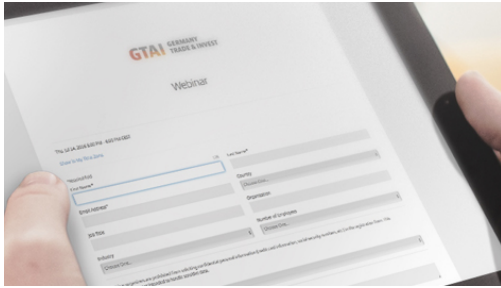
Pad mit Anmeldung zum Webinar