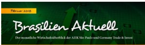
Newsletter Brasilien aktuell