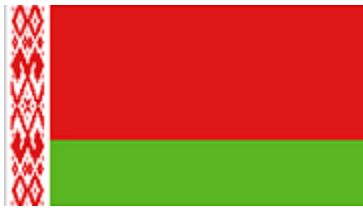
Flagge Belarus

Die wichtigsten Informationen auf einen Blick