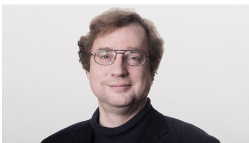
Achim Kampf | © GTAI